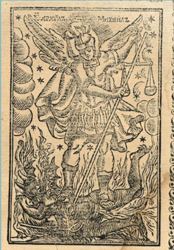
Архангел Михаил Абагар, 1651