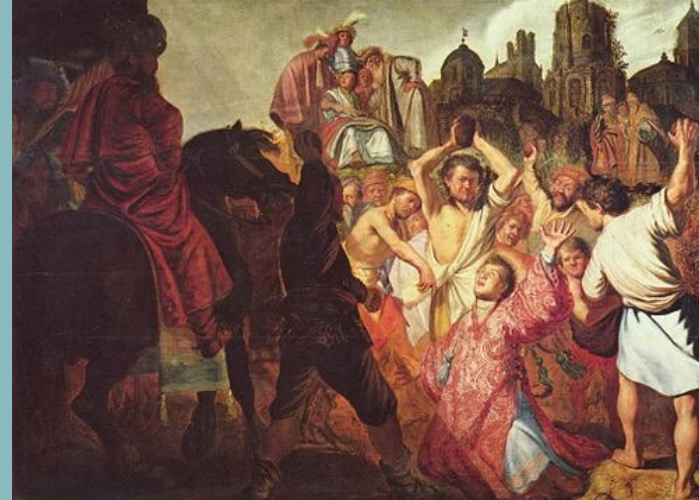
Убийството с камъни на св. Стефан Рембранд, 1625