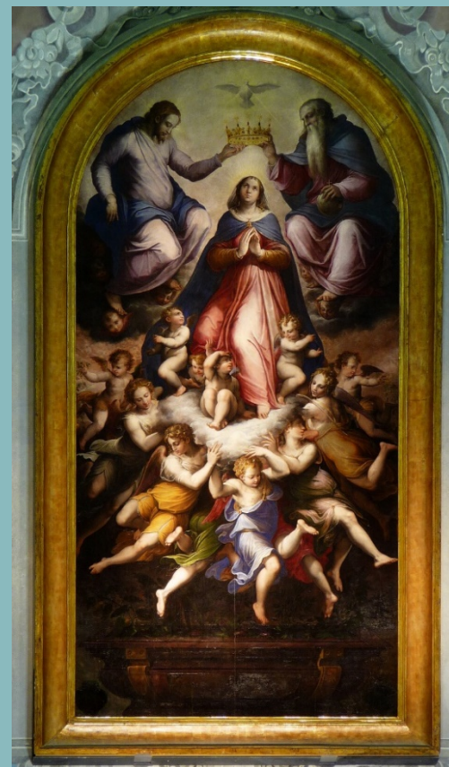
Коронация на Девата. Олтарно изображение от Джорджо Вазари (1511–1574), църква Санта Катерина, Ливорно, Италия