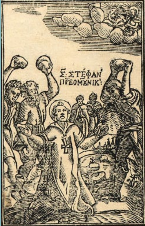
Убийството с камъни на св. Стефан Абагар, 1651