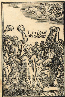
Молитва да цаете к самен Божя.

Слава ка кншнемъ Божь, и на Земанъ мир андан мухфаланмо тебе, благоуланмао тебе, класниамосе тебе, слазнамо тебе, хфама уданамо тебе, Господе Божь Царь Невесни, ботце моштити, Убавке слави твоеме риди, Синь иданни рождани, Наглице Божь, квои оданамаш грехъ Свѣта, сманасе нами, и приам моланна наша, зашто ти сам Свѣт не си Господ, прианшии Невкар те, с Духом Свѣтнемъ У слави Божя ботца, Амин.