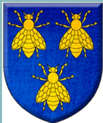
Герб на фамилия Барберини, към която принадлежи папа Урбан VIII