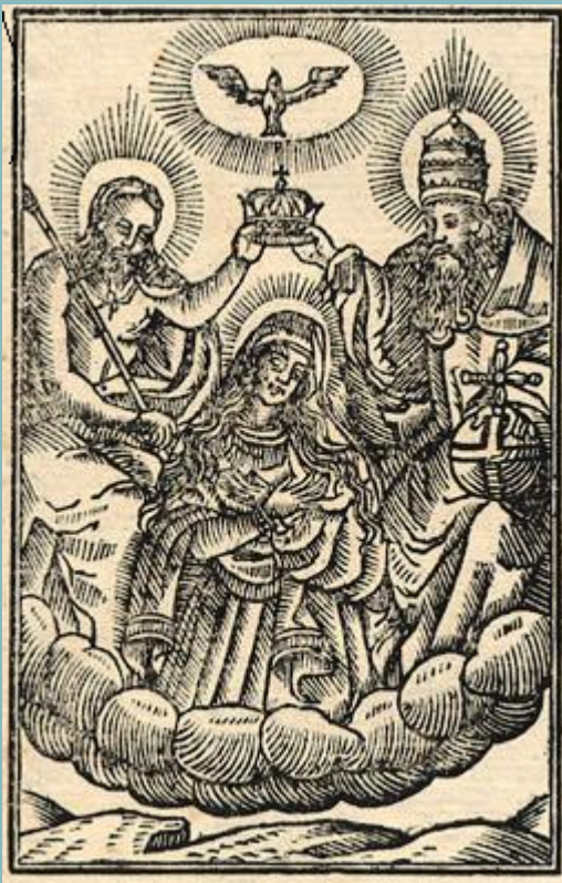
Коронясване на св. Богородица с Новозаветна Троица. Абагар, 1651

При четири от гравюрите, включени в „Абагар“, е ясно доловимо придържането към образци на бароковата живопис, продиктувано от стремежа към максимално дистанциране от православния иконописен модел.