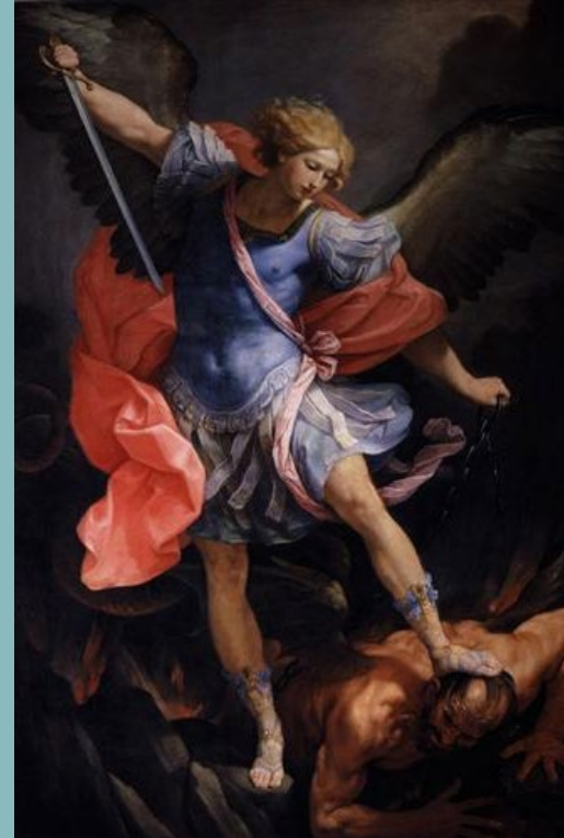
Архангел Михаил, побеждаващ Сатаната Гуидо Рени, 1635