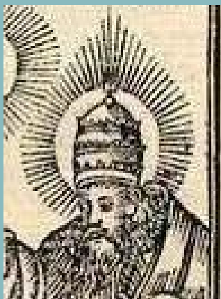
Бог Отец от началната гравюра в „Абагар“ е с папска тиара